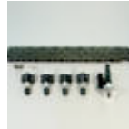
Rørfikstur ø 250-800mm

KHC-600 D 42 volt.....90122 Rørfikstur rørdiameter 250 – 800mm.....90123 Holder for montering stationær brug.....420-3102