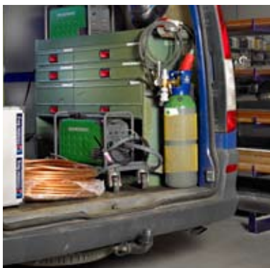
Migatronik Delta på sin faste plads i servicevognen.