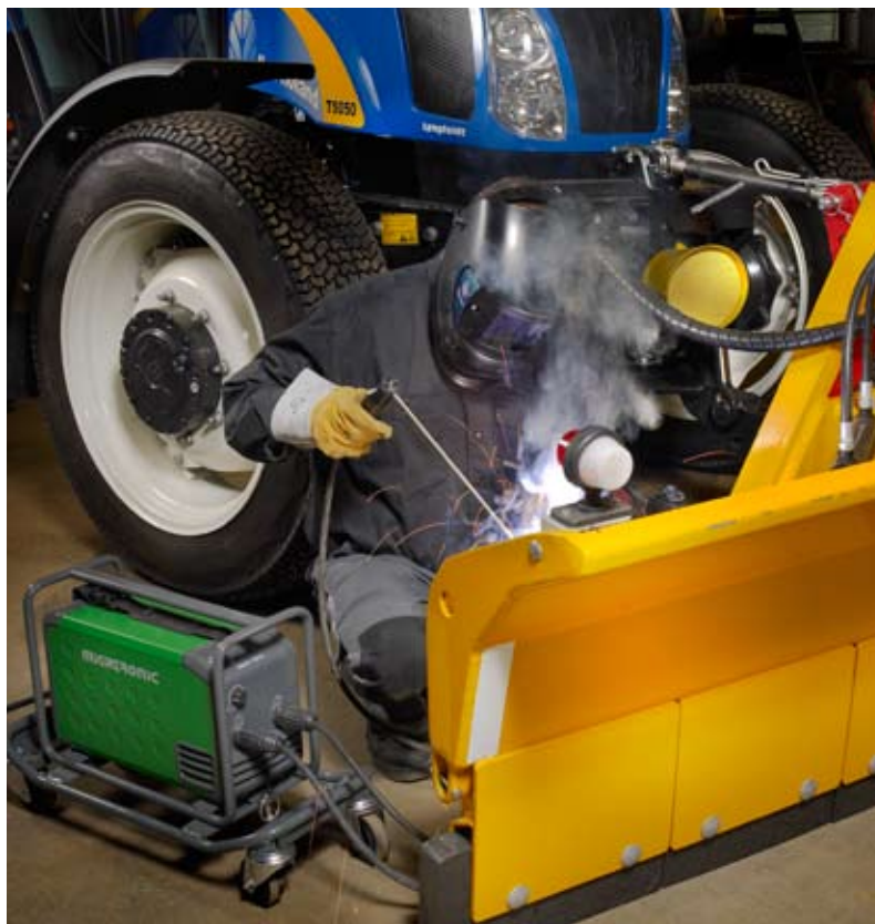
Den fleksible Delta i aktion ved reparation på værkstedet. Her vist med beskyttelsesramme og vogn med hjul.