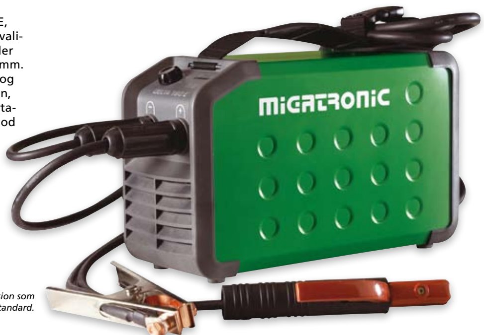
Delta E-version som den leveres standard.

Delta-familiens driftssikre MMA maskiner, Delta 140 E, 160 E og 180 E, præsterer kvalitetssvejsning i alle materialer med elektroder op til 3,25 mm. Med frit valg mellem plus- og minuspol på elektrodetangen, indbygget hotstart, lysbuestabilisering og egensikring mod udsving i netspændingen. Delta E kan med skrabetænding også anvendes til enkel TIG svejsning.