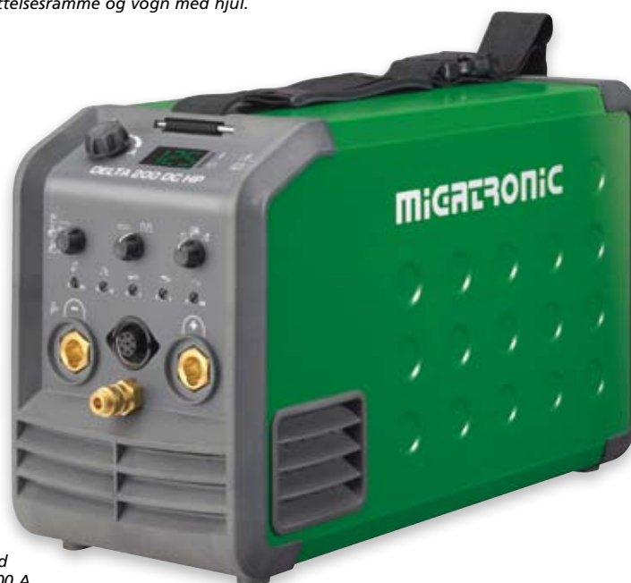
Delta 200 DC HP - den største TIG-version med trinløs puls og høj ydelse i strømområdet 5-200 A.