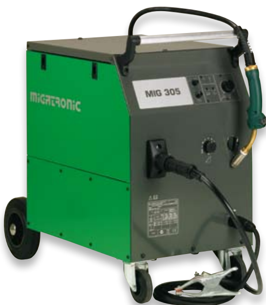
MIG 305 C - den mindste af kompaktversionerne.