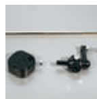
Cirkelslag 50 –550mm.