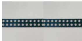
Skæreskinne 1800 mm.

Skæreskinne 1800 mm.....90018 Cirkelslag 50 – 550 mm.....33353 Transformator 42 volt.....90101