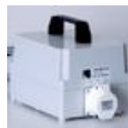
Transformator 220 – 42 volt.